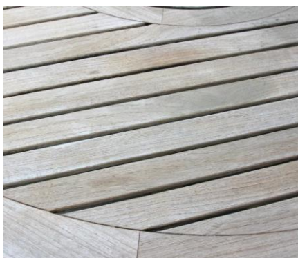
ΜΕ ΤΟΝ ΚΑΙΡΟ

Είναι σημαντικό, πριν την εφαρμογή του βερνικιού, να γίνεται προσεκτικό τρίψιμο της επιφάνειας με λεπτό γυαλόχαρτο (240) και στη συνέχεια απομάκρυνση της σκόνης. Εξίσου σημαντική είναι η χρήση ποιοτικού πινέλου.